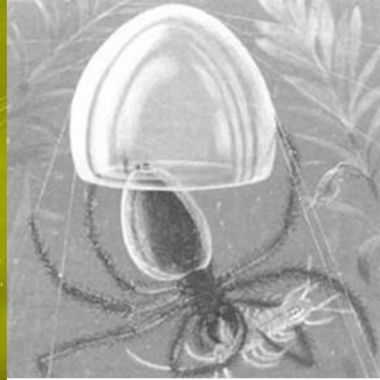
Воздушный колокол паука- серебрянки