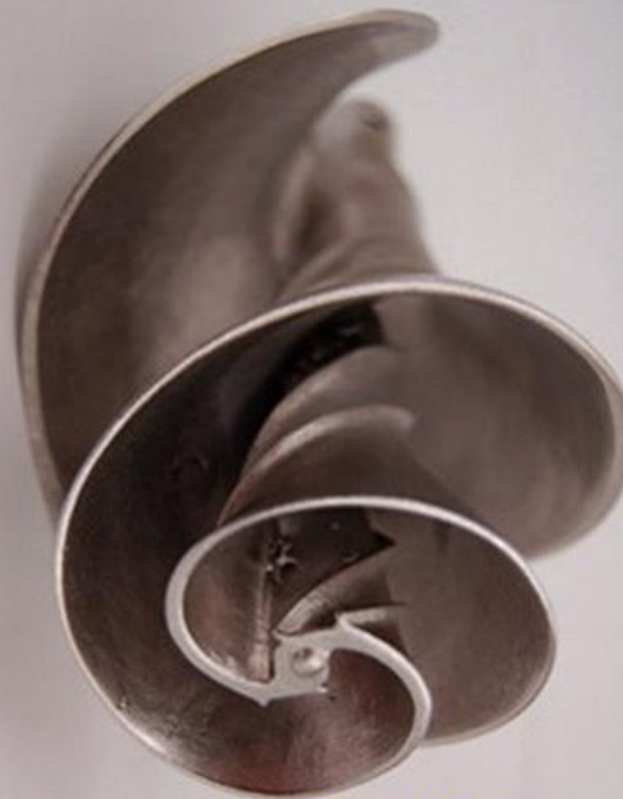
Калла (Calla lily) и водный смеситель