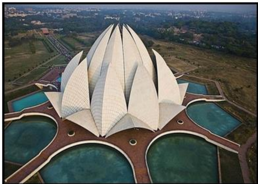
Храм Лотоса (Индия)