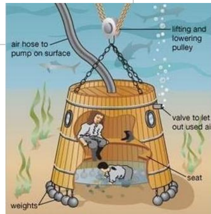
Водолазный колокол Галилея